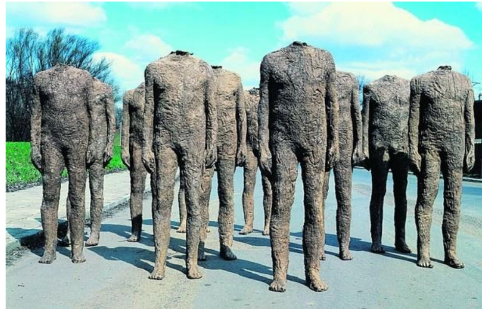
Magdalena Abakanowicz, Tłum, 1988