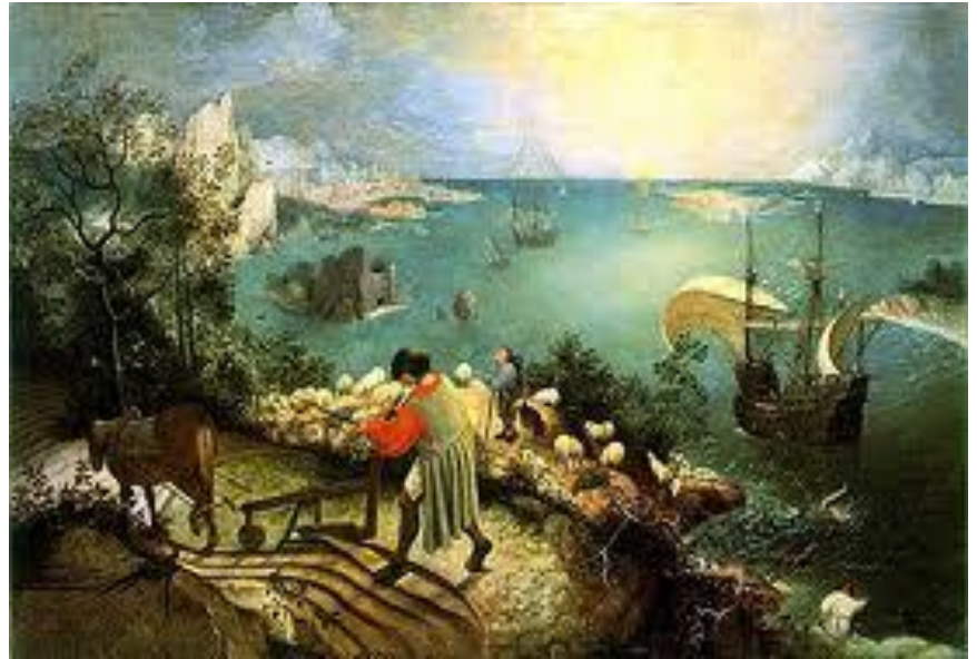
Pieter Bruegel (starszy), Pejzaż z upadkiem Ikara, ok. 1558, Królewskie Muzeum Sztuk Pięknych w Brukseli